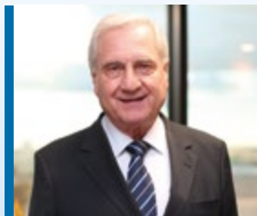
Alfredo Cotait Neto presidente da CACB